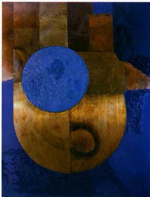
Αφιέρωμα στον Cimabue: ξύλο, μέταλλο, λάδι 200 × 150 εκ.