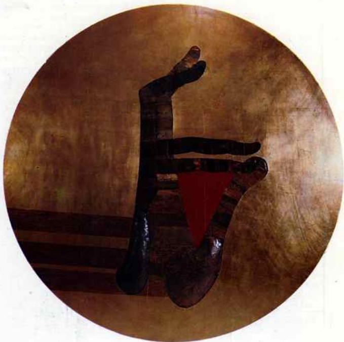
Χέρι: ξύλο, μέταλλο, μέταλλο δουλεμένο «au repoussé» διαμ. 165 εκ.