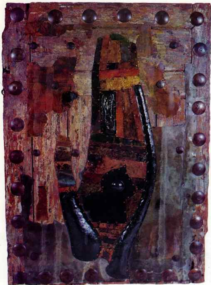
Χέρι II: ξύλο, μέταλλο, λάδι 117 x 87 εκ.

Main II: bois, métal, huile 117 x 87 cm.