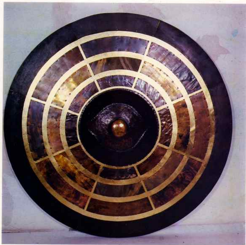
Μάη & Ξύλο, μέταλλο, μέταλλο δουλεμένο «au repoussé» διαμ. 110.