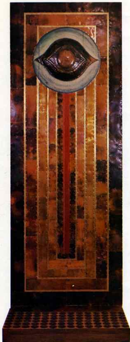
Παράθυρο: αντικείμενο από ξύλο και μέταλλο 220 x 80 x 60. Fenetre: objet en bois et métal 220 x 80 x 60.