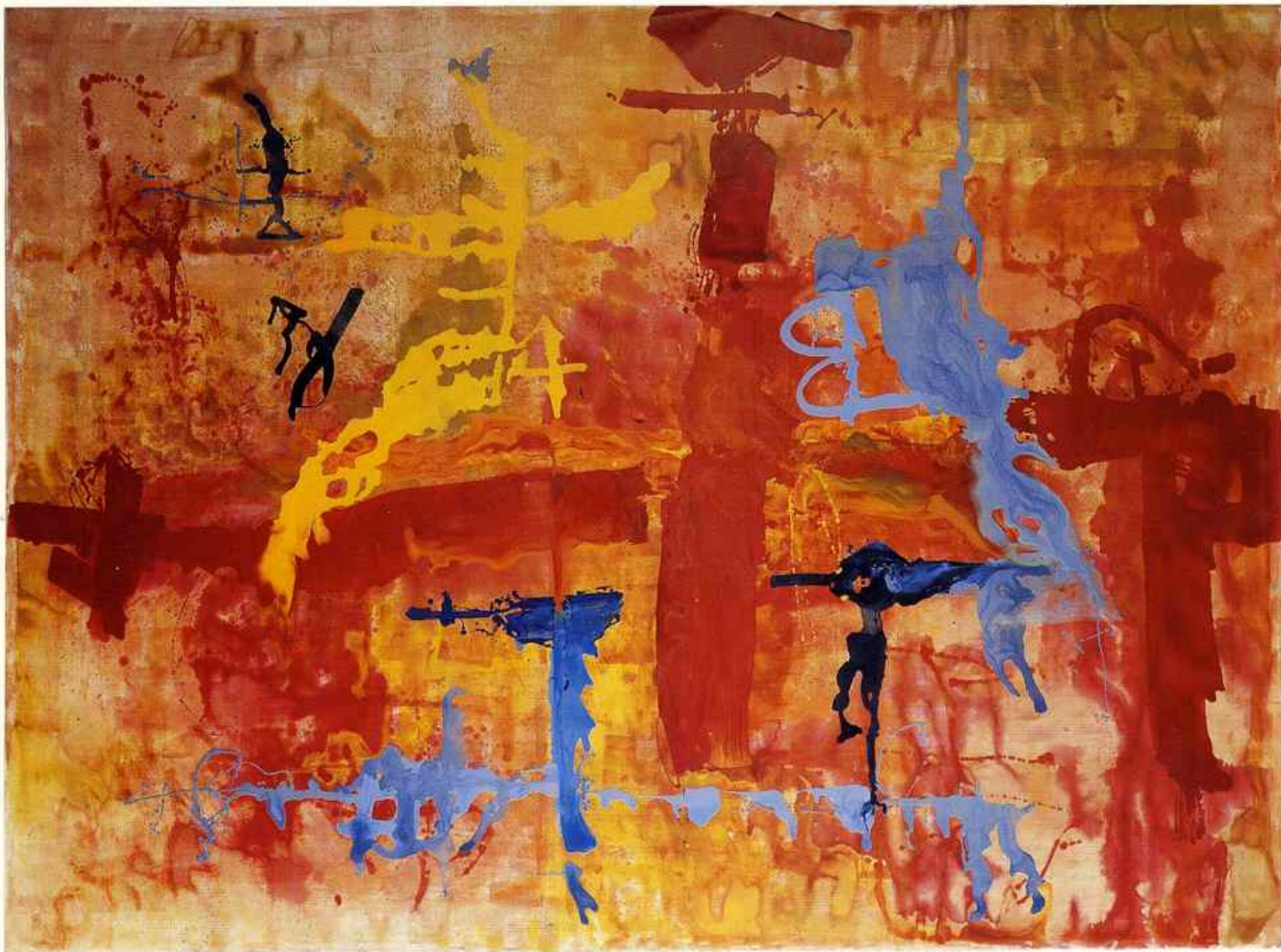
ECRITURE - huile sur toile 420 x 316 cm.