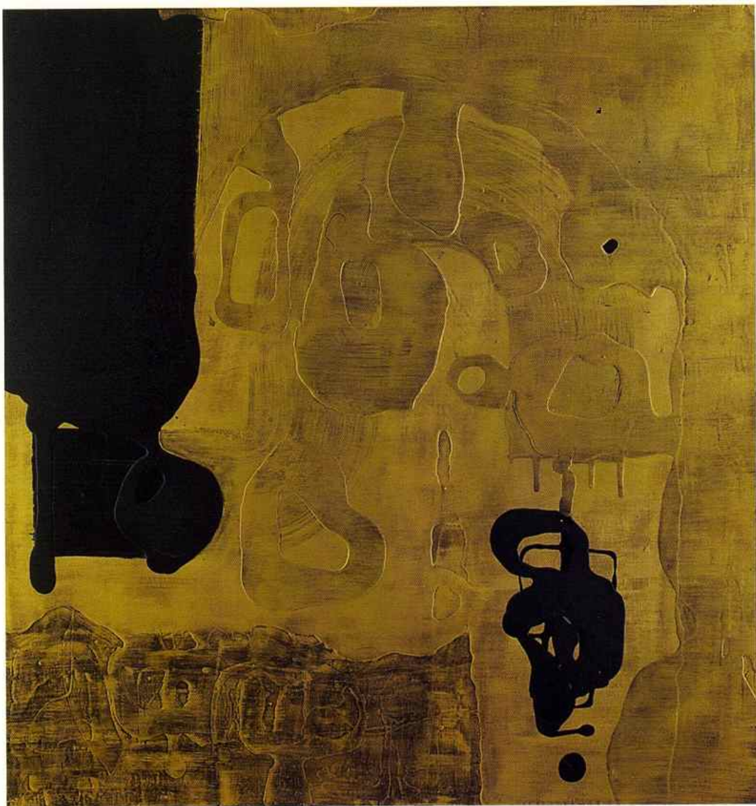
SIGNES Technique mixte - 120 x 120 cm