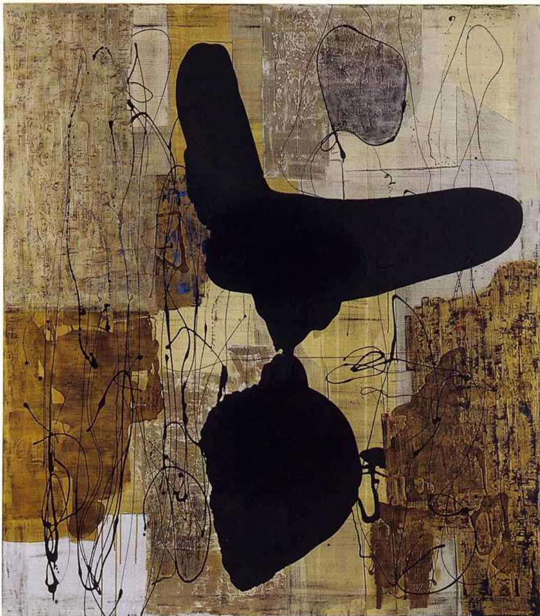
PROMÉTHÉE Technique mixte - 180 x 160 cm.