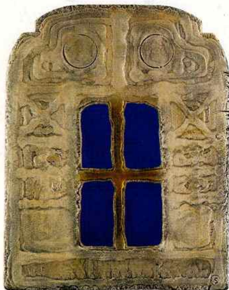
Tabernacle - 2001 Technique mixte sur bois 45 x 58