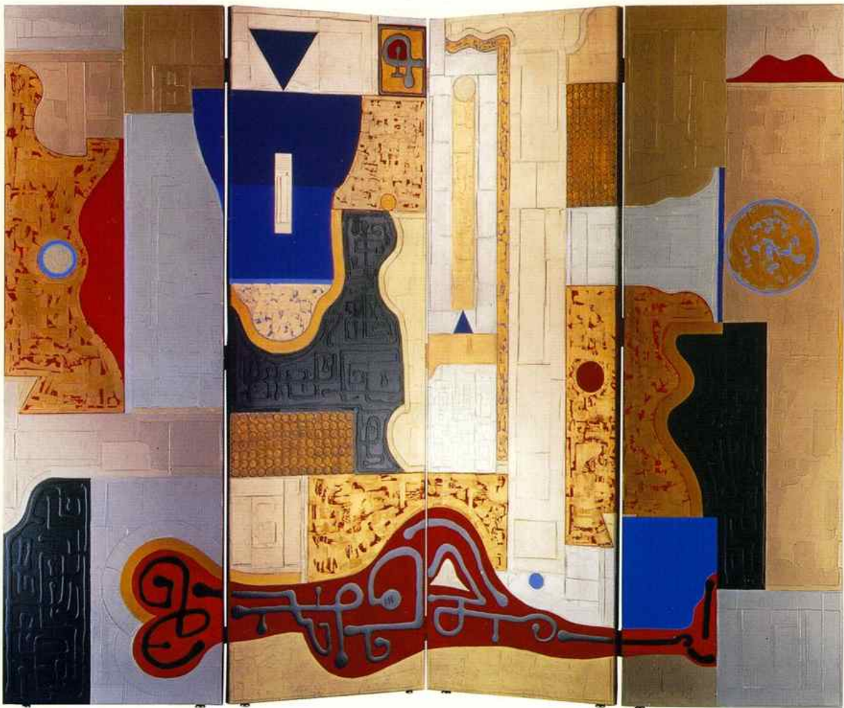
Le Jardin Erotique - 2001 Paravent (recto) Technique mixte sur bois 252 x 204