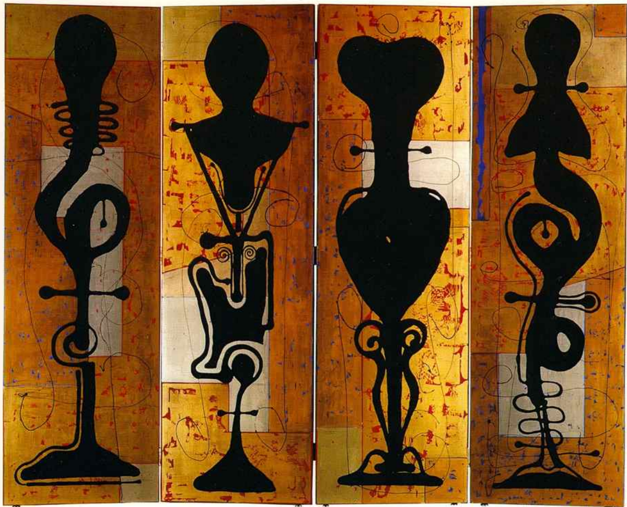
Totems - 2001 Paravent (verso) Technique mixte sur bois 252 x 204