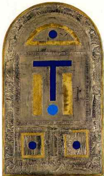
Portail - 2001 Technique mixte sur bois 80 x 141