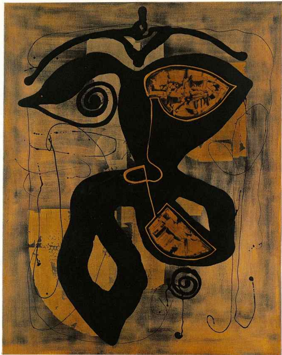
Le Minotaure - 1999 Technique mixte sur toile 114 x 146