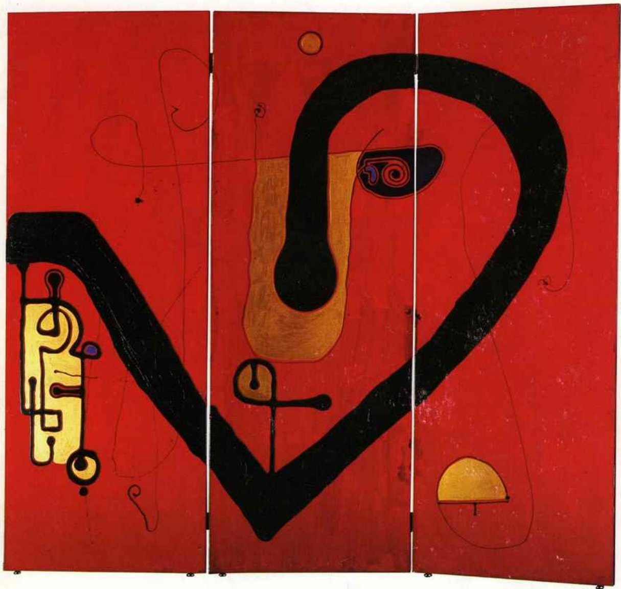
Exposition de Stefan Râmniceanu 21 mai - 21 juillet 2001